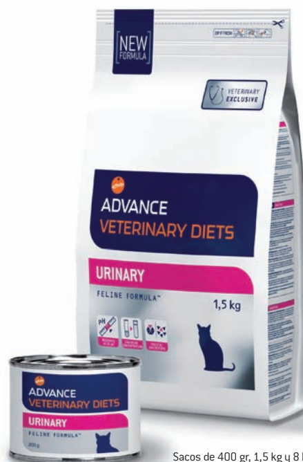
Sacos de 400 gr, 1,5 kg y 8 kg.

La alimentación de ADVANCE VETERINARY DIETS URINARY fórmula es la base para la salud del gato con la sintomatología asociada a las vías urinarias. La presentación de alimento seco y latas permite combinar la dieta del animal y mejorar la salud del sistema urinario.